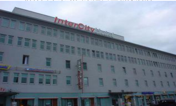
柏林火車東站共築之四星城際酒店