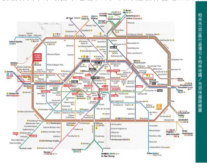
柏林市郊區行遊導引柏林地鐵／市郊快線路線圖