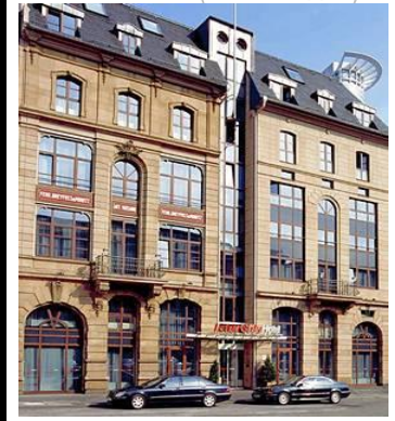
法蘭克福火車站邊三星城際酒店(走路即達會場)