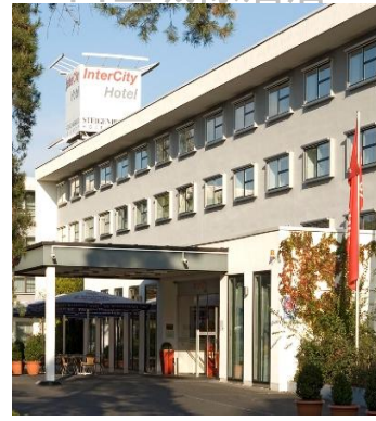
法蘭克福機場邊四星城際酒店